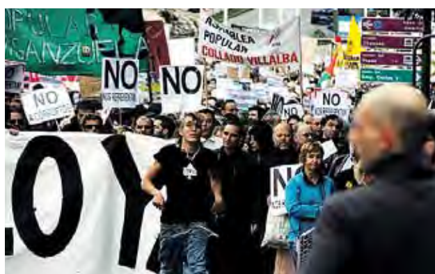
MANIFESTACIÓN INDIGNADA EN MADRID. FOTO: ÁLVARO MINGUITO

Legislará el gobierno en base a dos referencias: los