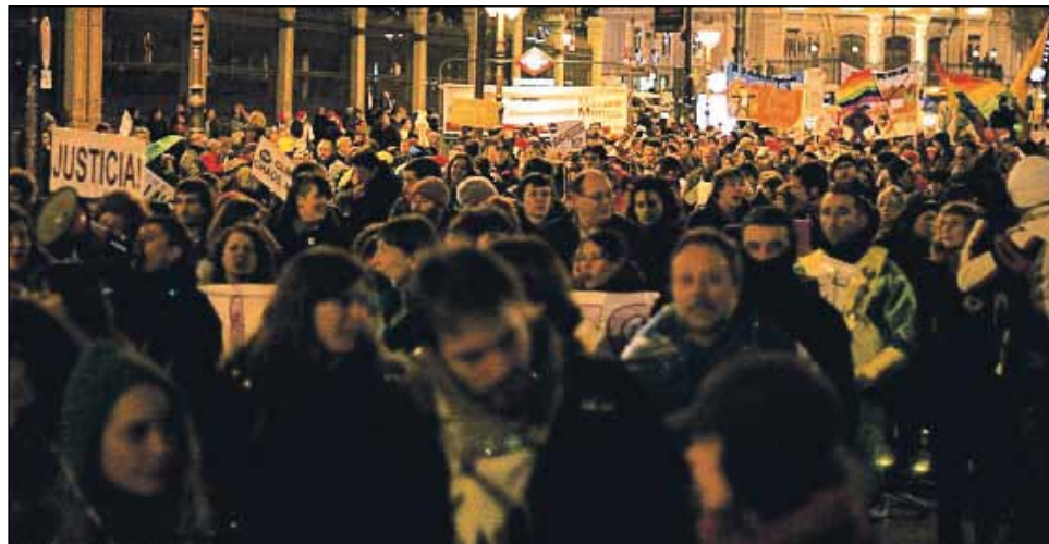
UN MOMENTO DE LA MANIFESTACIÓN AL PASO POR LA CALLE ALCALÁ

No fue una gran manifestación, pero los miles que acudieron superaron con creces las expectativas, porque se trataba de seguir en la calle y proclamar en tono festivo que se ha perdido la inocencia.