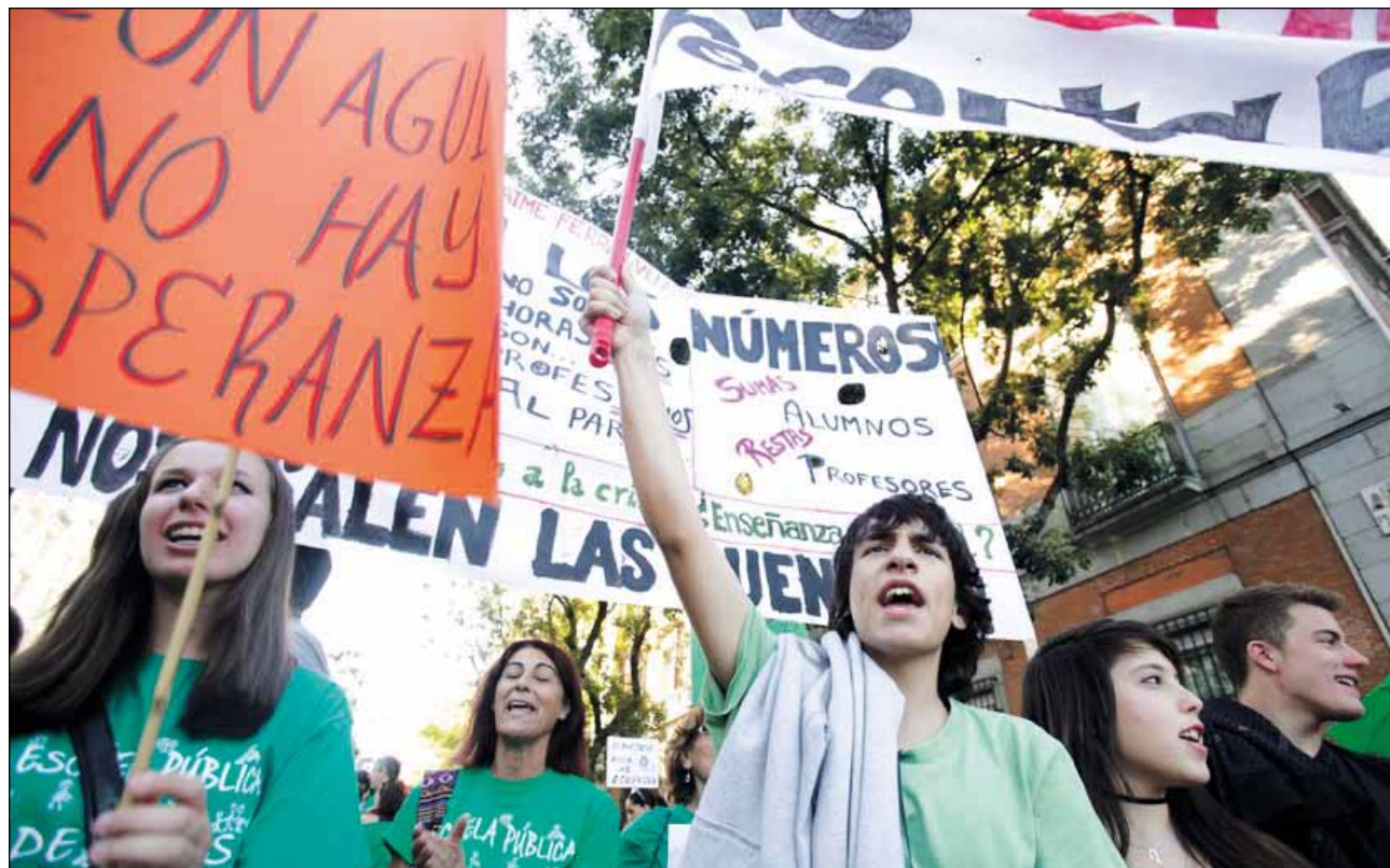
MANIFESTACIÓN CONTRA LOS RECORTES EN LA EDUCACIÓN.

Actualmente las políticas de expansión, para que sean eficaces, deben conllevar reformas drásticas del BCE y de los mercados.