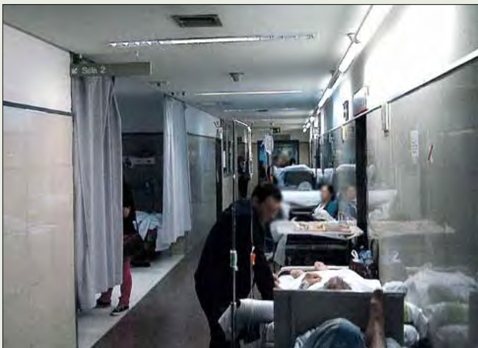
ASPECTO DE URGENCIAS EN CAN RUTL.