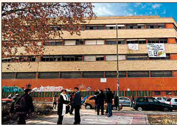
VISTA PANORÁMICA DEL EDIFICIO.

Se trata del antiguo economato, que llevaba catorce años abandonado, y prometía ser una zona residencial