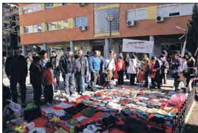
IMAGEN MERCADILLO DE TRUEQUE

Bicicrítica, mercadillo de trueque multireciproco, "liberación" de libros, exposición callejera de fotos y pinturas y batucada.