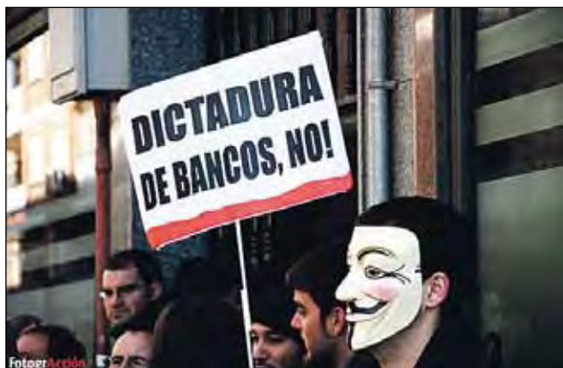
IMAGEN PARALIZACIÓN DESAHUCIO EN TORREJÓN.

El problema se ha generalizado en todo el país. Desde 2007 se han ejecutado más de 500.000 hipotecas, la mayoría en los últimos años. El caso de Madrid es especialmente sangrante. Según UGT, desde 2008 hasta el primer trimestre de 2011, se han presentado 20.556 ejecuciones hipotecarias - 3.878 en 2008; 5.222 en 2009, 8.919 en