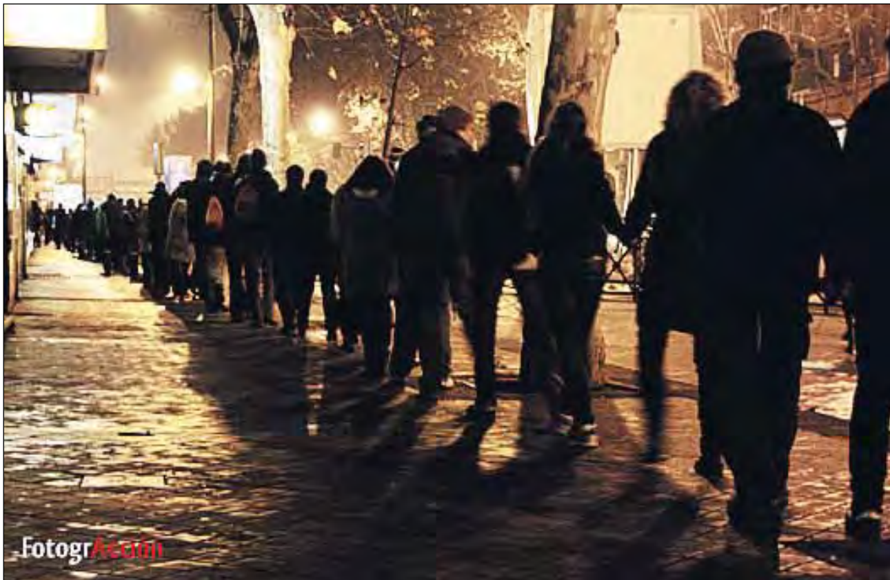
ESPECTACULAR CADENA HUMANA EN TORNO AL EDIFICIO.

El 15 de enero, más de 200 personas se reunieron a las puertas del número 36 de la calle Sebastián Elcano para formar una cadena humana en torno al edificio. El motivo: prestar apoyo a las personas que permanecían sin salir desde hacía una semana, temiendo no poder volver a entrar.