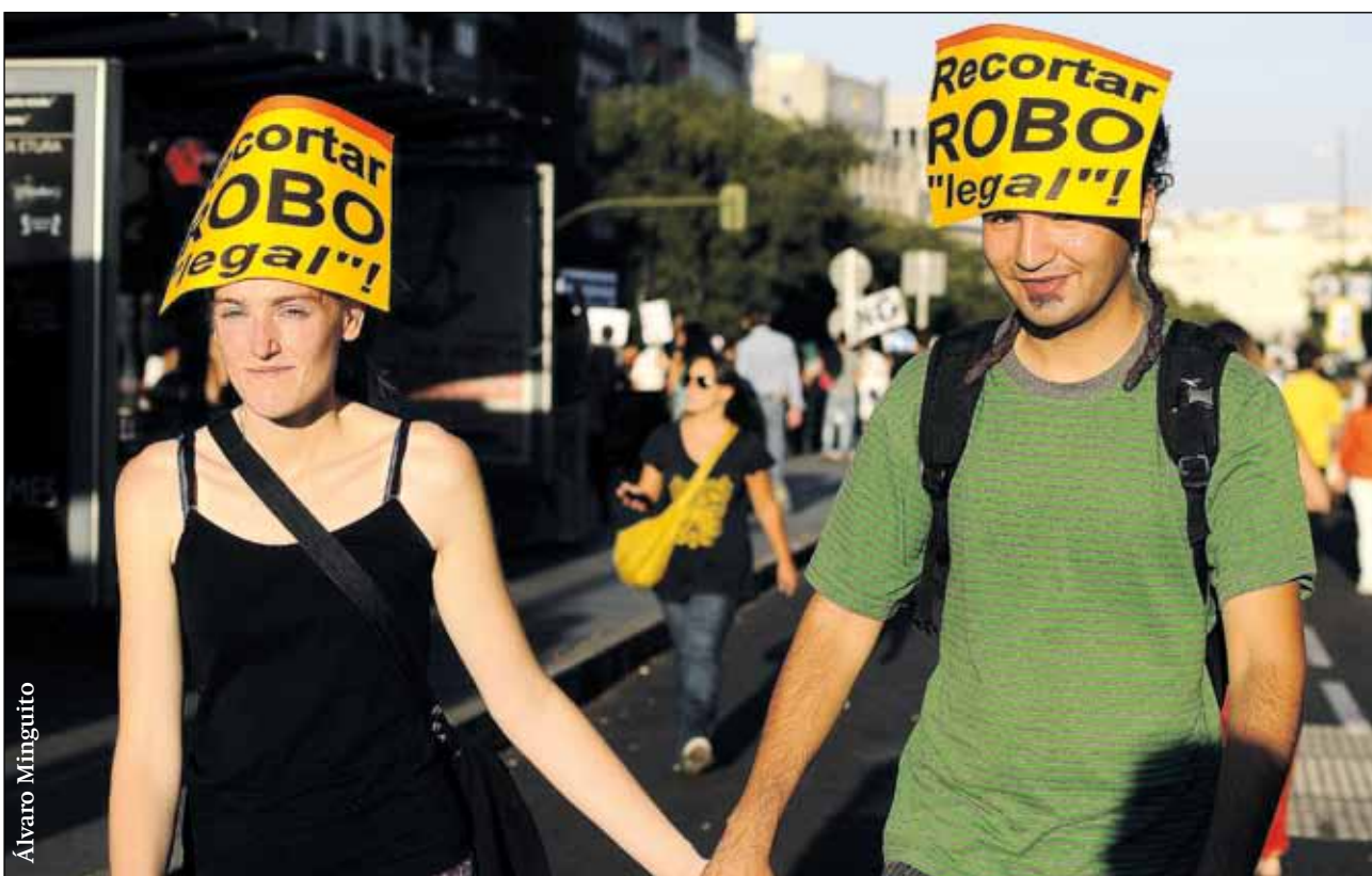
OFRECIENDO AL MAL TIEMPO NUESTRA MEJOR CARA, SEGUIREMOS CAMINANDO