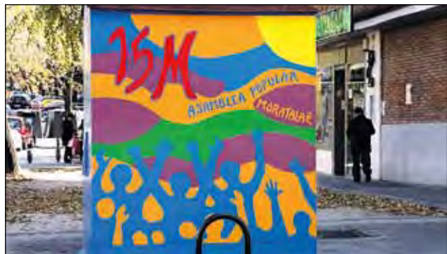
IMAGEN DEL PUNTO DE INFORMACIÓN DE LA A.P. DE MORATALAZ

Desde su creación, el 28 de mayo, la Asamblea Popular de Moratalaz ha realizado más de 20 eventos públicos y gratuitos en el barrio. Actividades culturales, informativas y didácticas para concienciar de que es urgente un cambio que anteponga los derechos de la ciudadanía a los intereses económicos.