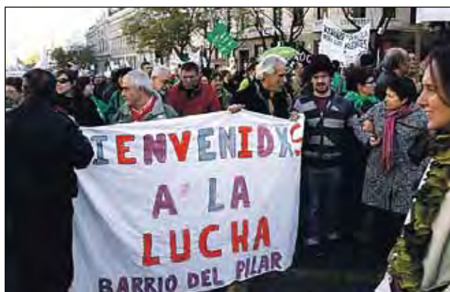
LA A. P. DEL BARRIO DEL PILAR EN UNA MANIFESTACIÓN DE LA MAREA VERDE.

La asamblea se sumará a la gran manifestación en defensa de todos los sectores públicos madrileños del 7 de febrero.