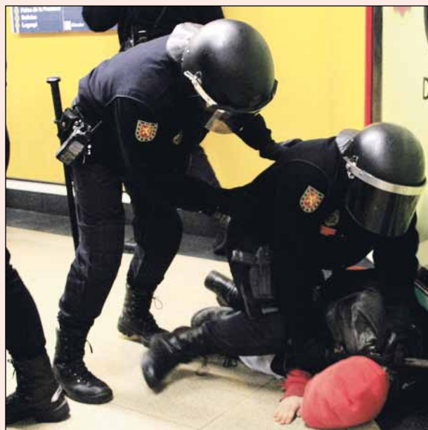
INTERVENCIÓN DESPROPORCIONADA DE LA POLICÍA.

En Madrid, la acción estaba convocada a las 17.00 horas en la estación de Metro de Sol. Alrededor de un centenar de personas pretendían saltar el control de entrada como "protesta simbólica". Sin embargo, decenas de antidisturbios impedían el acceso de todas las entradas de Metro de Sol, por lo que el grupo se dirigió a la cercana estación de Callao.